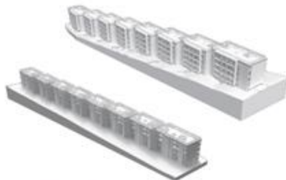
Bâtiment D Perspectives