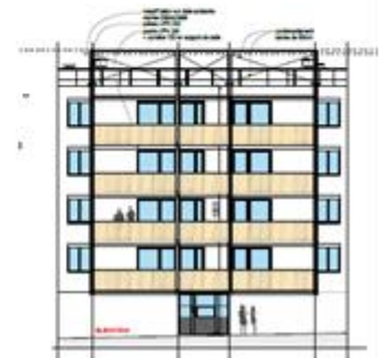
PRINCIPE FACADE Ech : 1/200