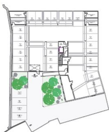
CAPACITAIRE – PLAN MASSE